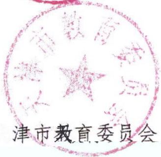
天津市教育委员会