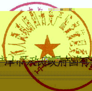
天津市人民政府国有资产监督管理委员会