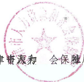
天津市人力资源和社会保障局